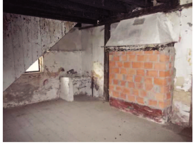
04- EX LABORATORIO DI FALEGNAMERIA