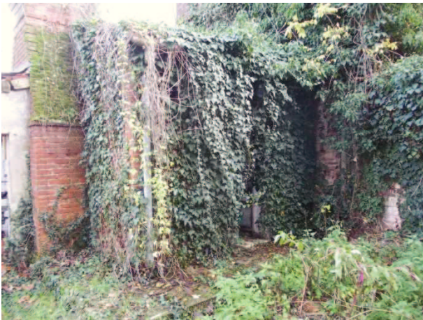
07- INGRESSO (INTERNO)