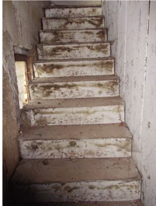
8- PORZIONE DI SCALA IN LEGNO