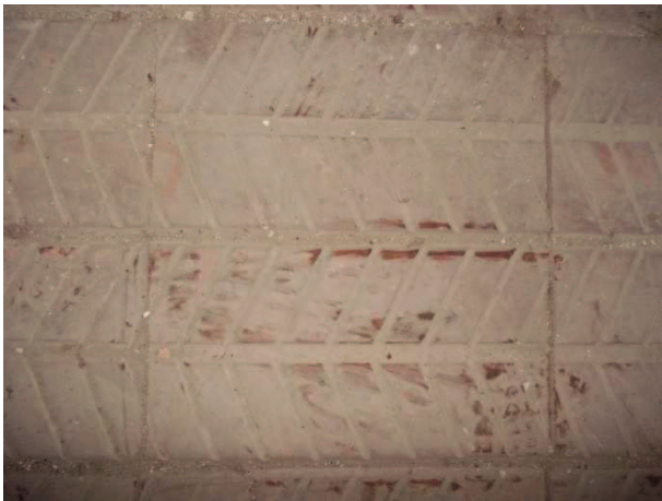
9- PAVIMENTO IN LATERIZIO