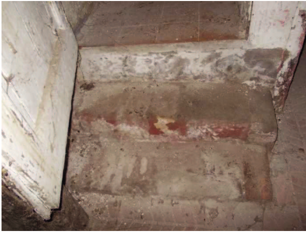
7- PORZIONE DI SCALA IN MATTONI