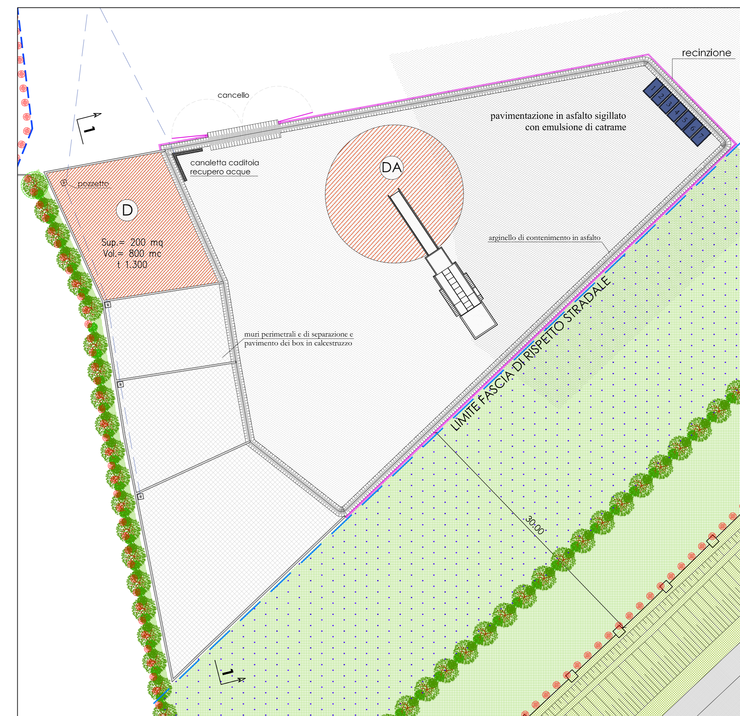
LAYOUT LINEA TRATTAMENTO D - FRANTUMAZIONE INERTI DA DEMOLIZIONE