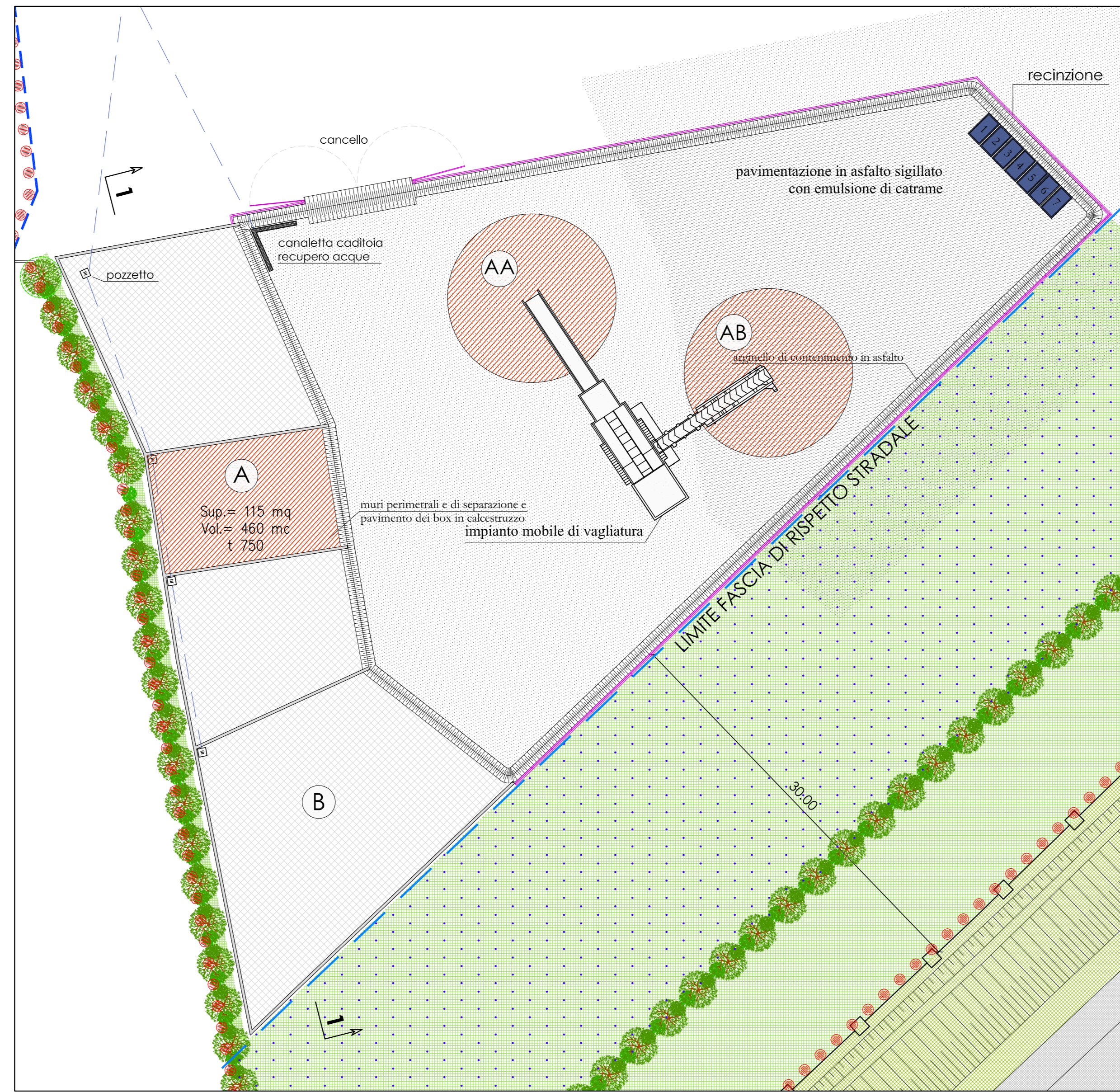
LAYOUT LINEA TRATTAMENTO A: VAGLIATURA TERRE E ROCCE (a matrice terrosa)

35010 Castiglione di Stabia (PD) - Via Verdi 17 - Tel. 049 9957822 - Fax. 049 9439252 - Email: studio@borgoprogetti.it