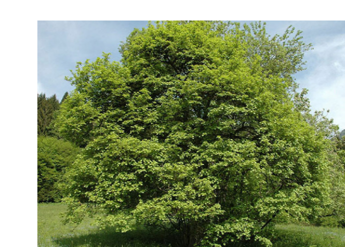
A ACER CAMPESTRE (Acero campestre)