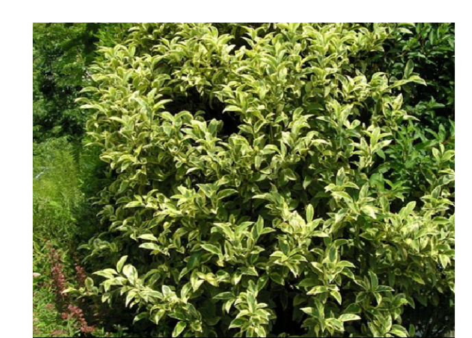
B LIGUSTRUM (Ligustro)