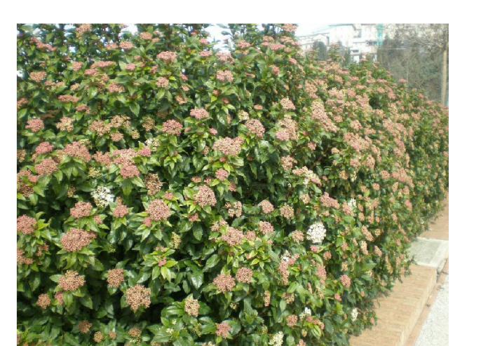
C VIBURNUM LANTANA (Lantana)