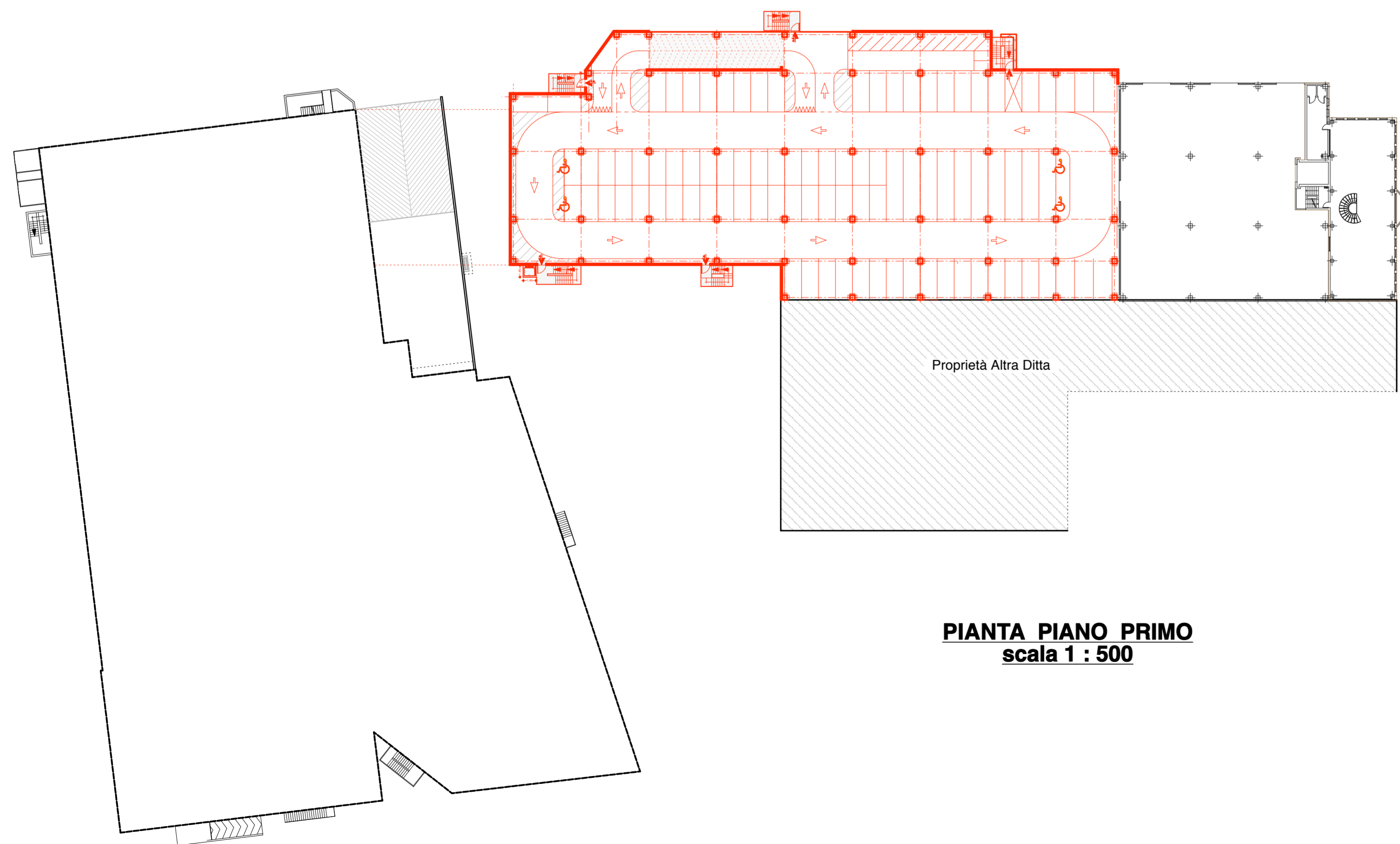
PIANTA PIANO PRIMO scala 1 : 500