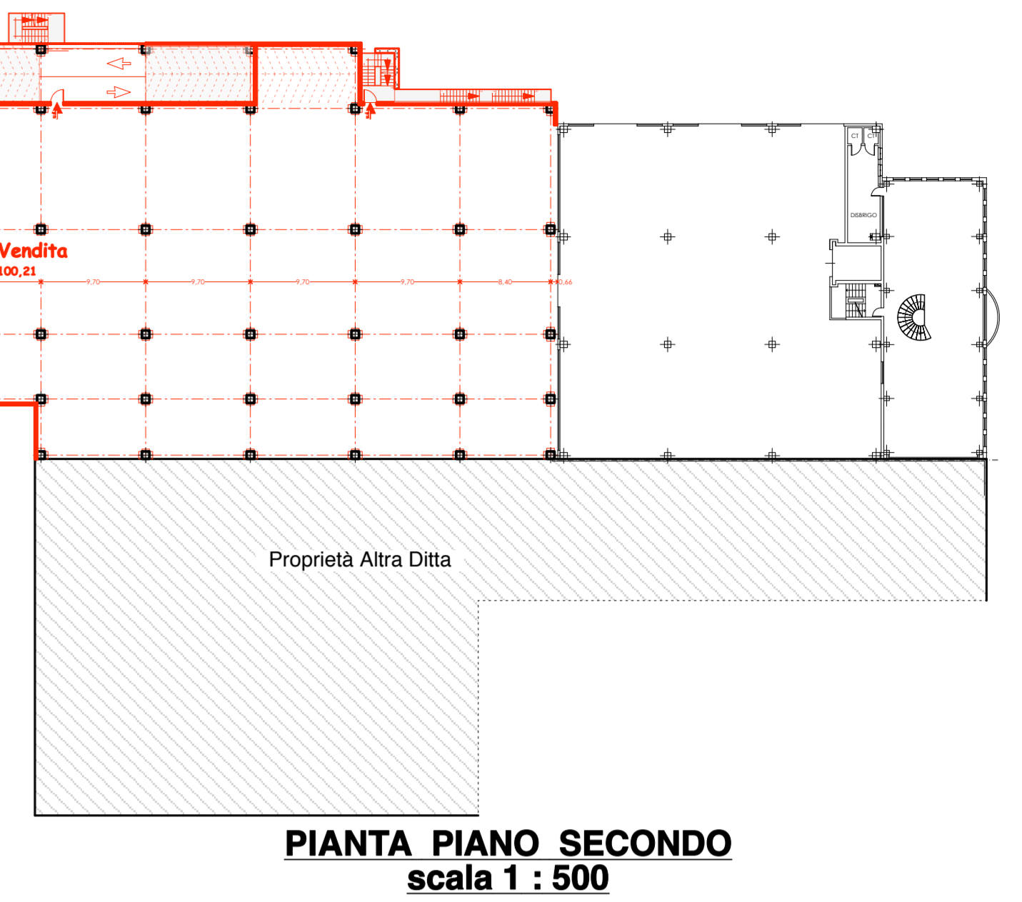
PIANTA PIANO SECONDO scala 1 : 500