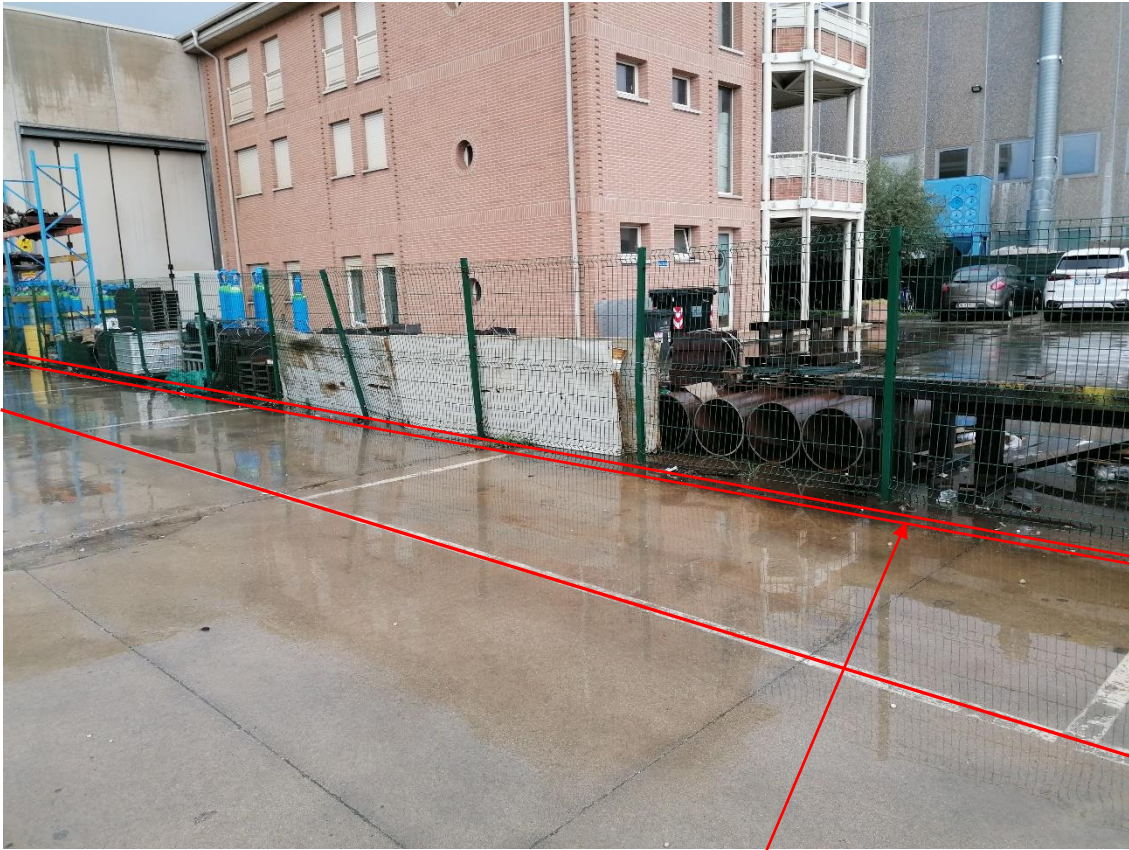
3. Area D6 – Stoccaggio autoveicoli bonificati su cantilever con cordolo per compartimentazione acque