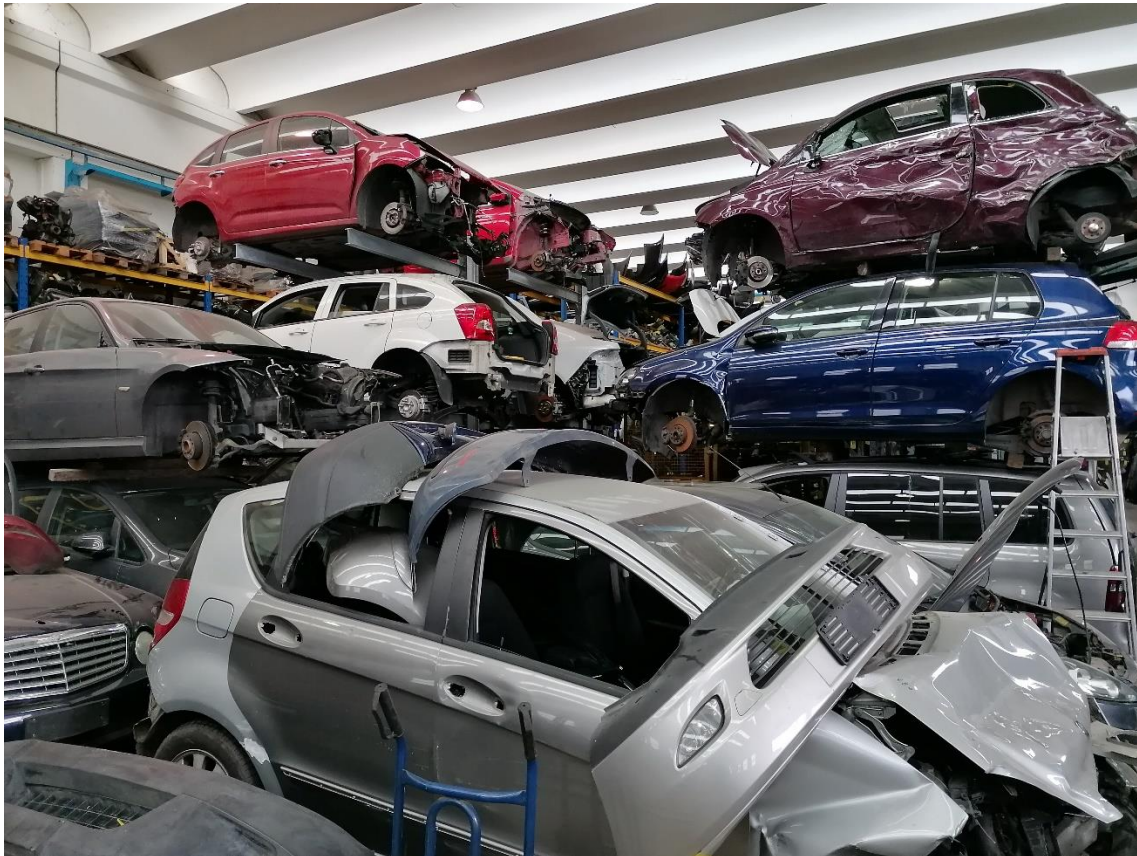
7. Area D3 – Stoccaggio veicoli bonificati