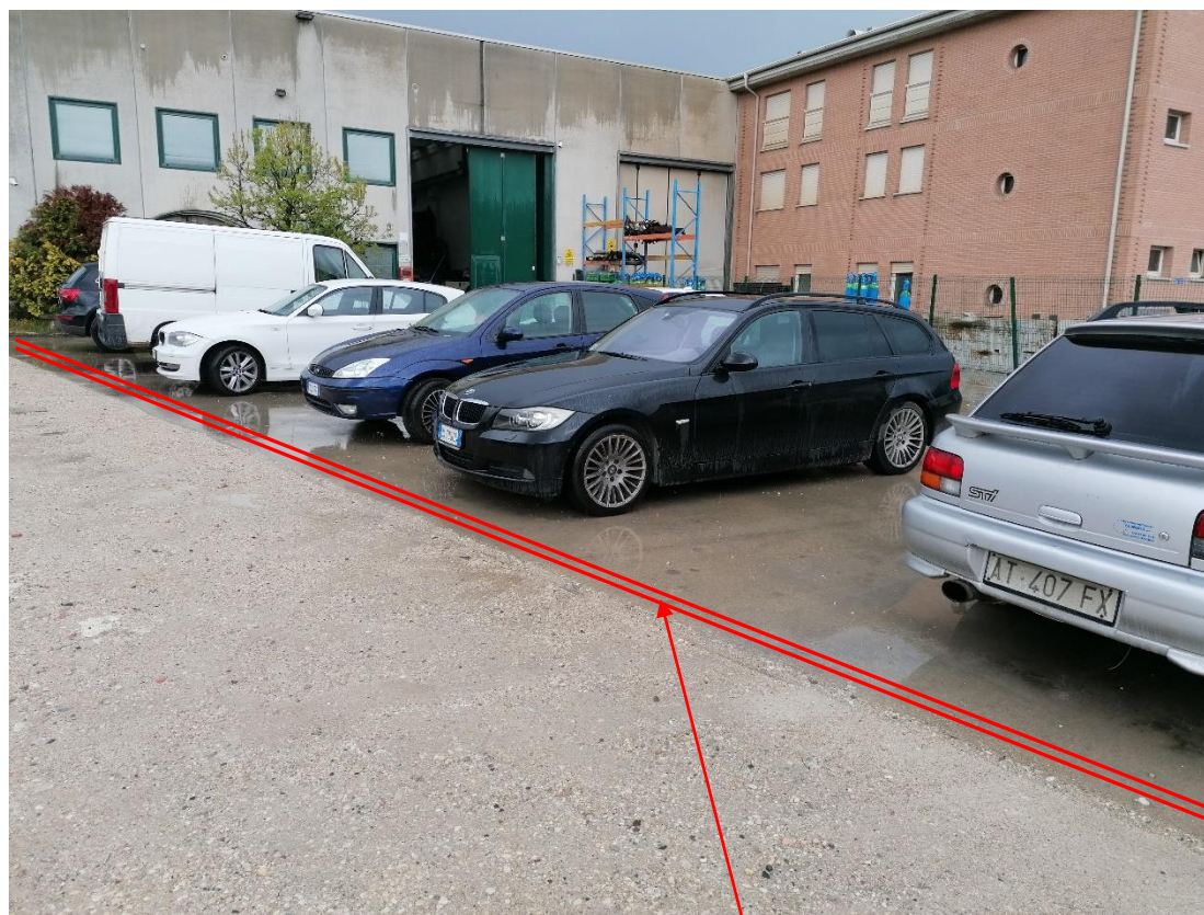
2. Area D1 – Stoccaggio autoveicoli da bonificare con griglia di raccolta acque