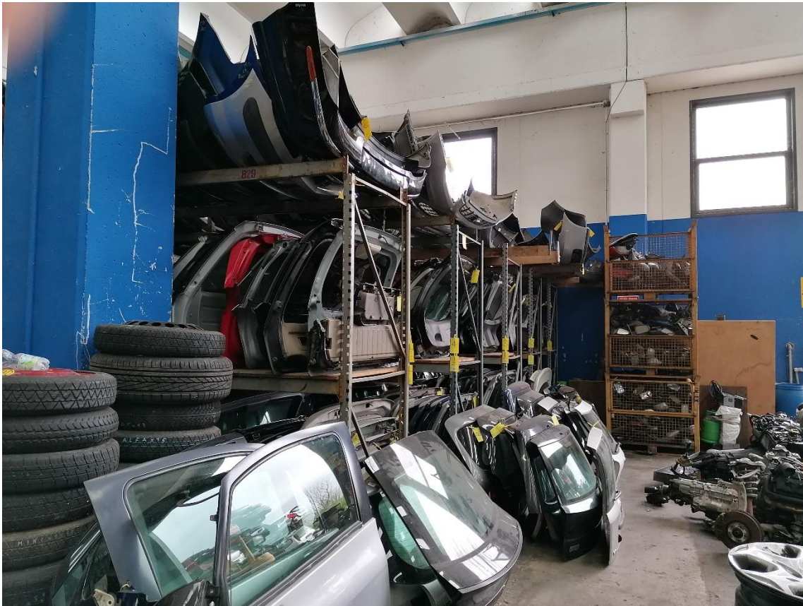
9. Magazzino ricambi