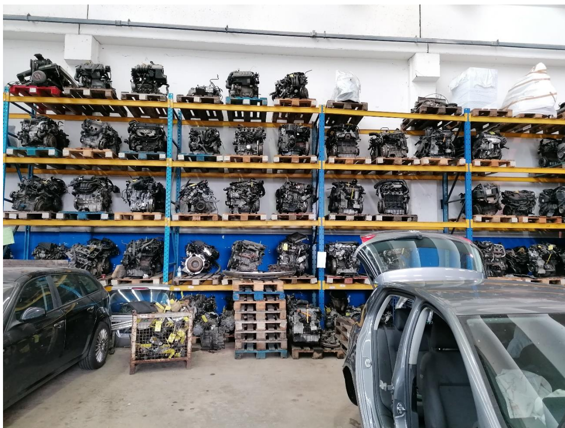
8. Deposito parti di ricambio