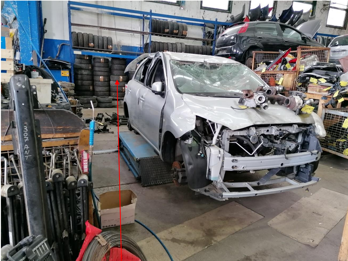
5. Smontaggio pezzi e deposito ricambi – gomme e cerchi