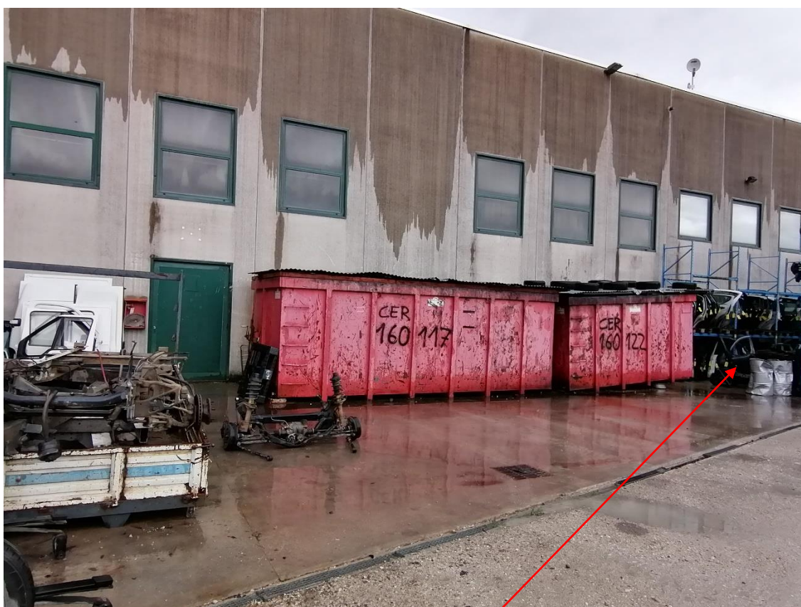
12. Cassoni 22 (EER 160117) e 31 (EER 160122) – Parti di ricambio