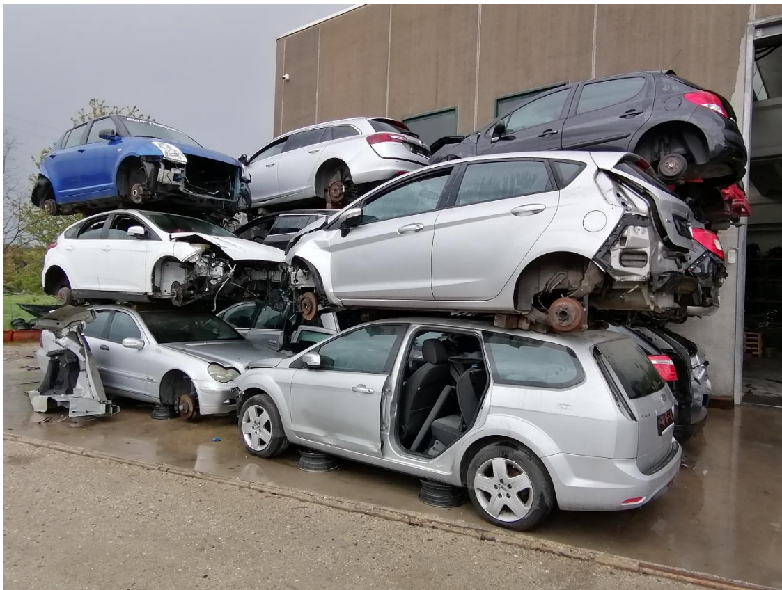
11. Area D2 – Stoccaggio autoveicoli bonificati