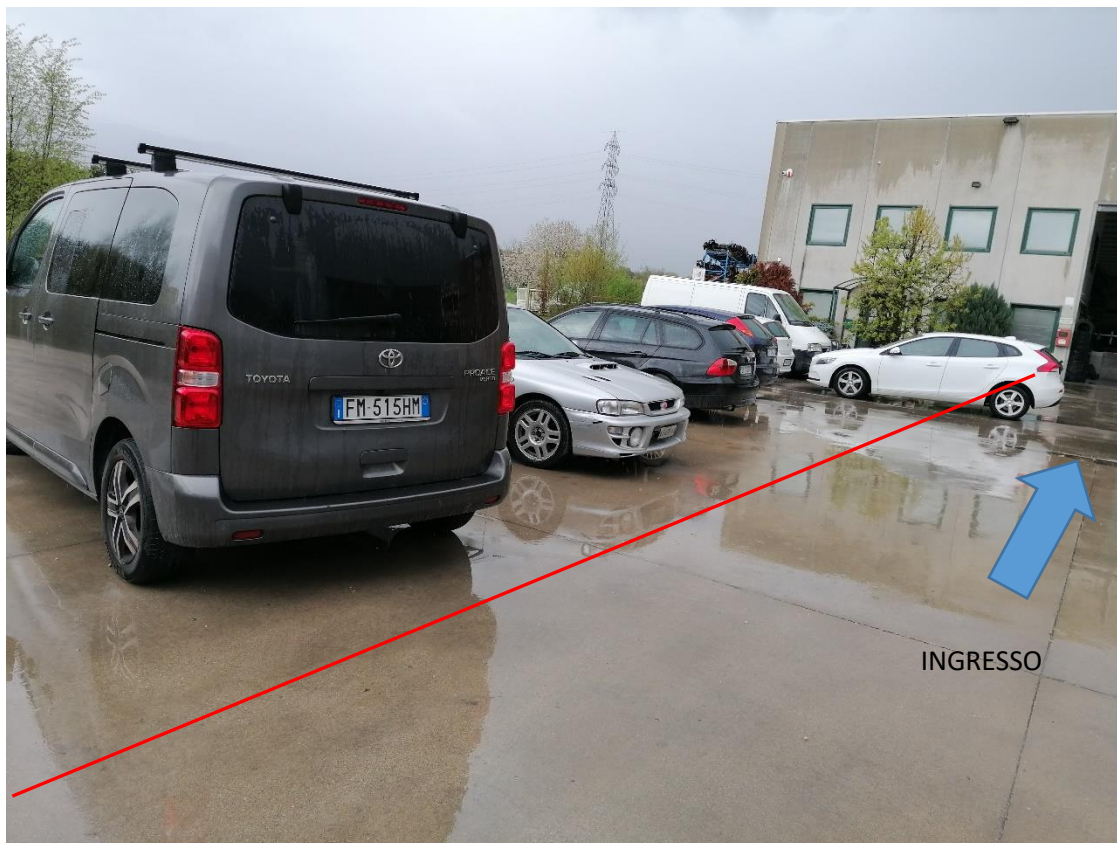
1. Area D1 – Stoccaggio autoveicoli da bonificare