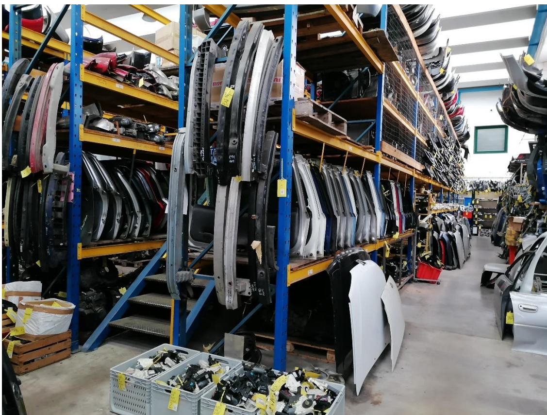
10. Deposito parti di ricambio