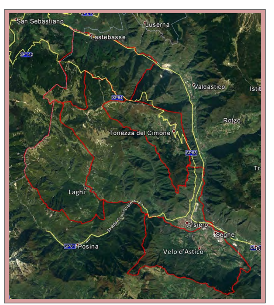
TAV. 1.2 - DENSITA' DI POPOLAZIONE DEL TERRITORIO