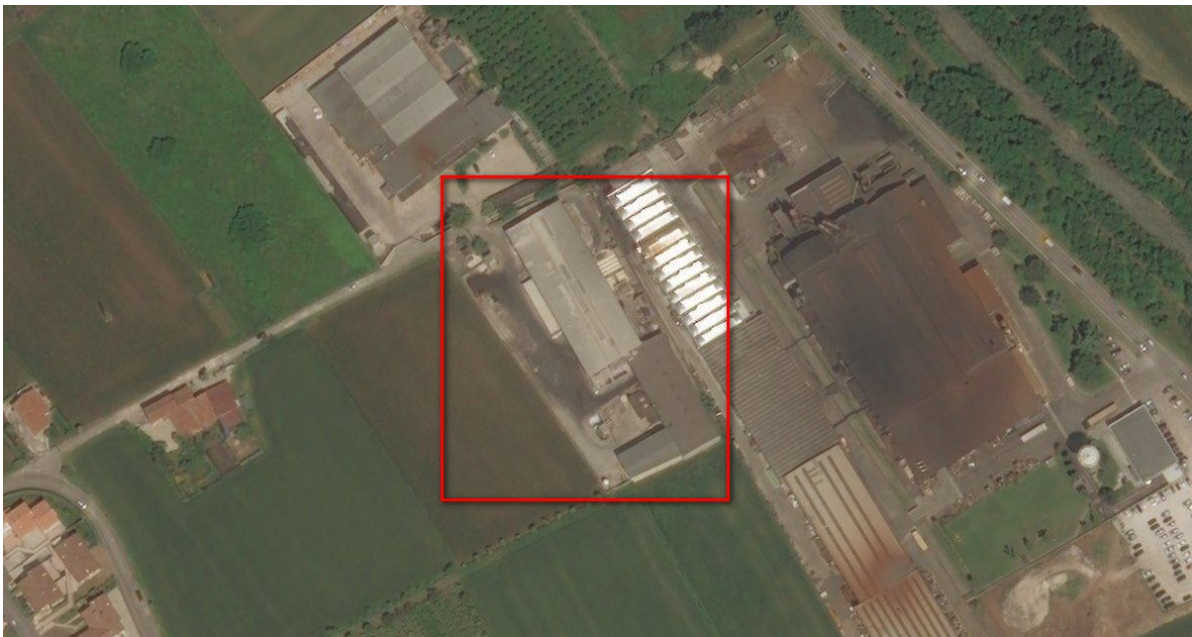
Ortofoto del sito