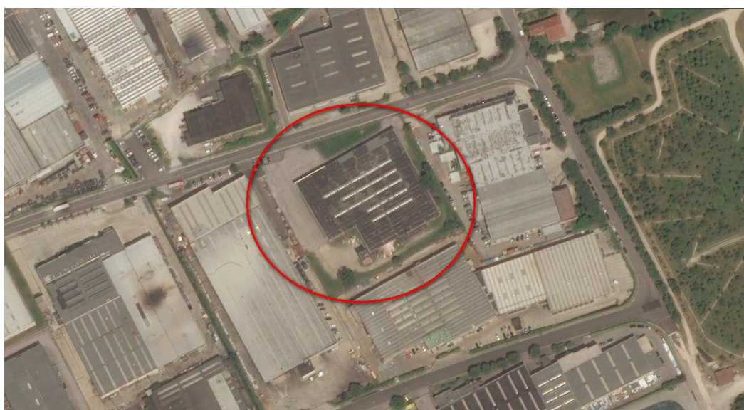
Ortofoto del sito