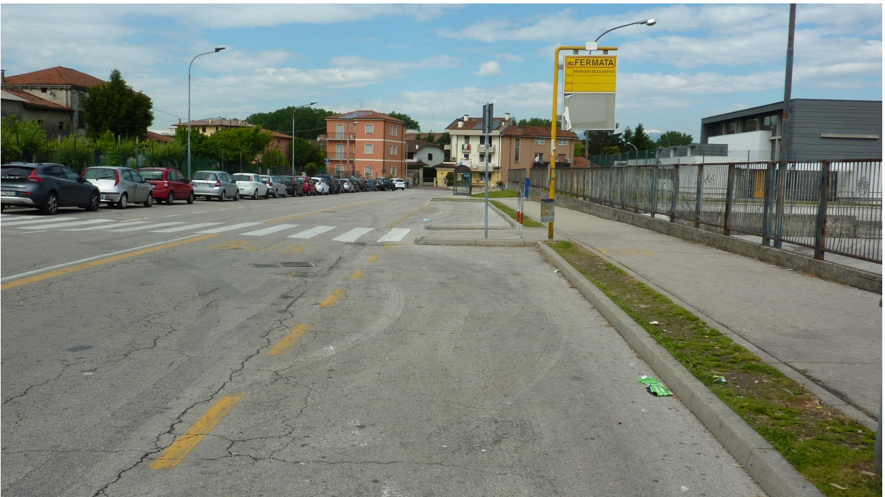
Foto 5: via B. Powell verso Stradella Mora: aiuola a verde a separazione del marciapiedi dalla carreggiata