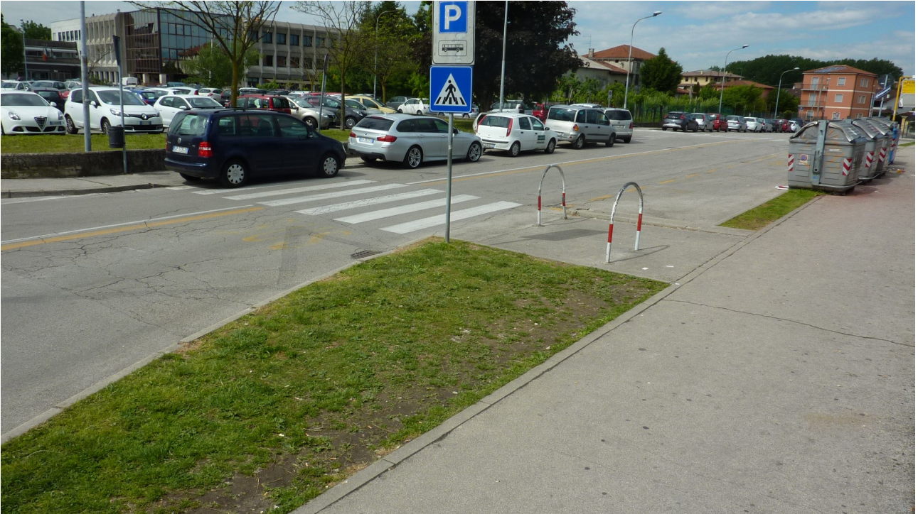
Foto 4: via B. Powell verso Stradella Mora: aiuola a verde a delimitare la curva e gli attraversamenti pedonali