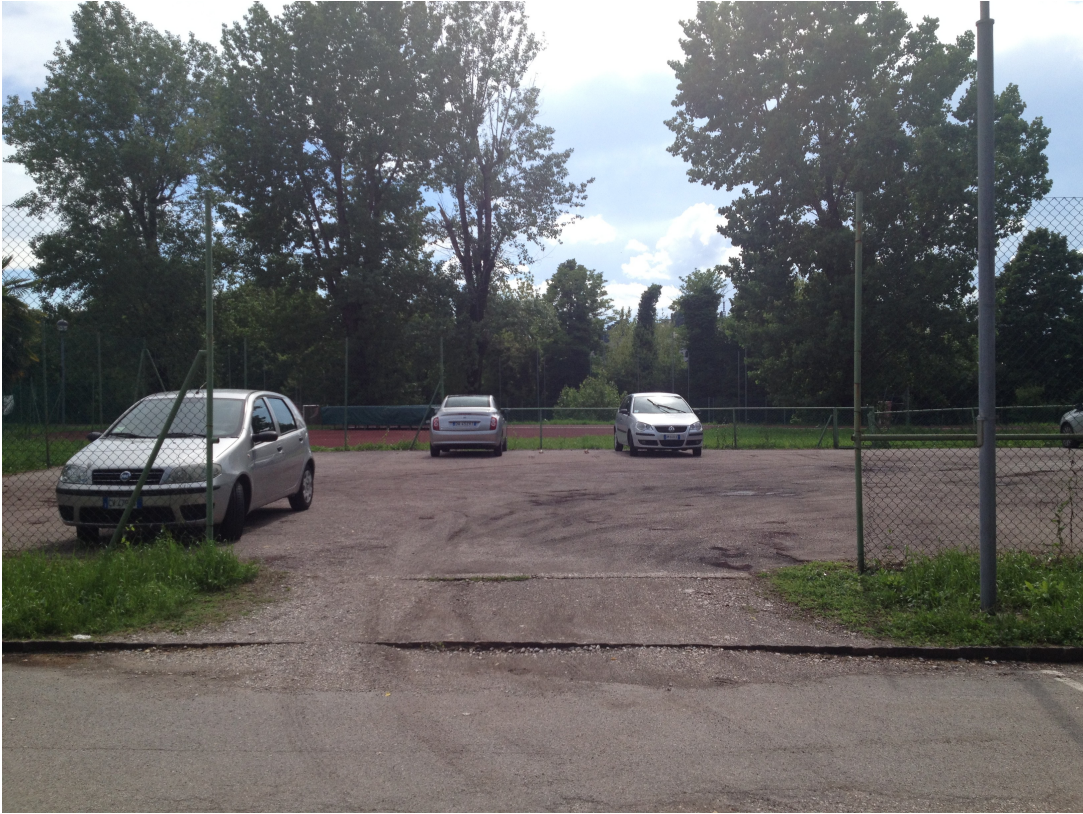
Foto 9: ingresso alla seconda area destinata a parcheggio posta sulla destra del viale di ingresso all'istituto