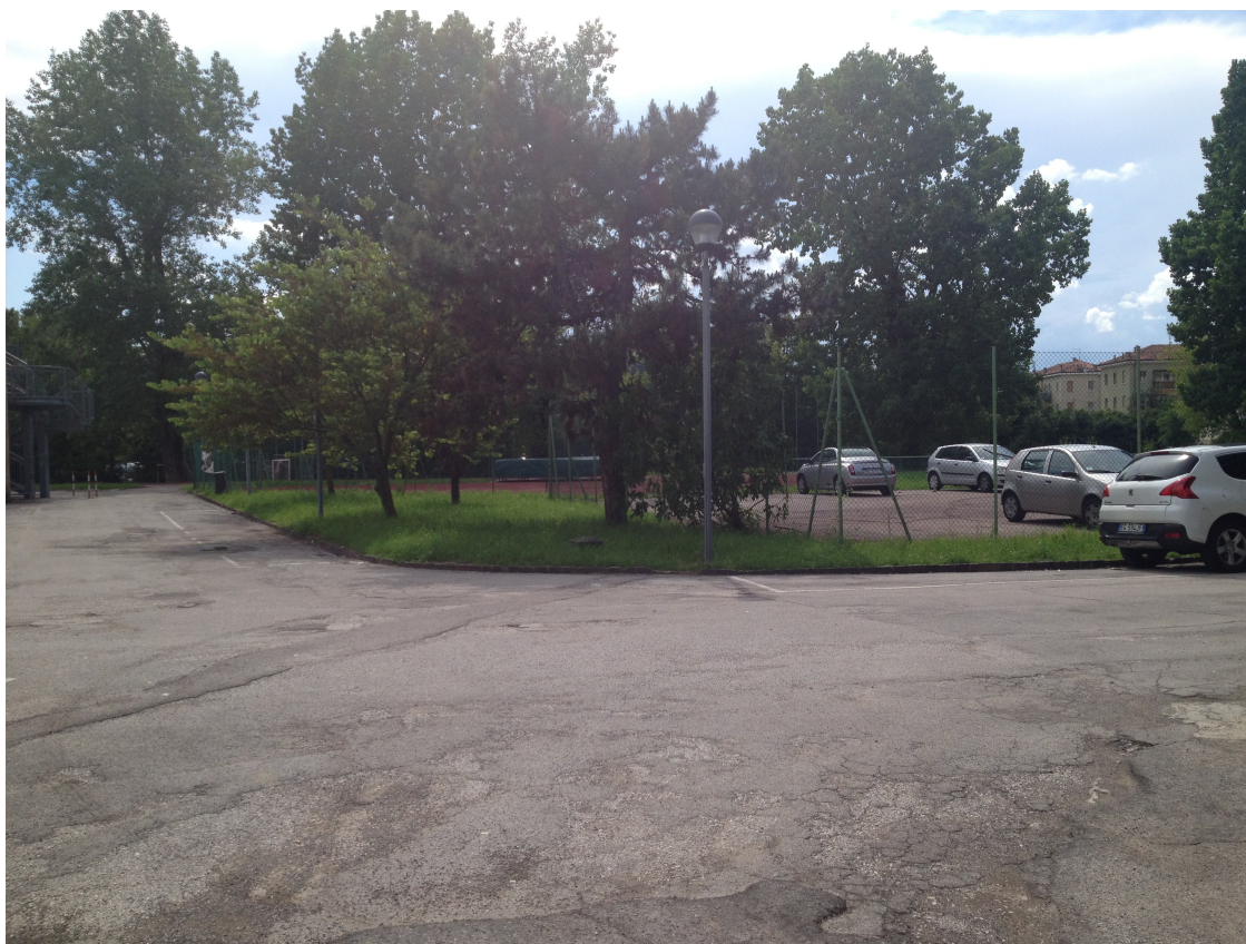
Foto 8: vista dal piazzale principale posto di fronte all'ingresso dell'istituto