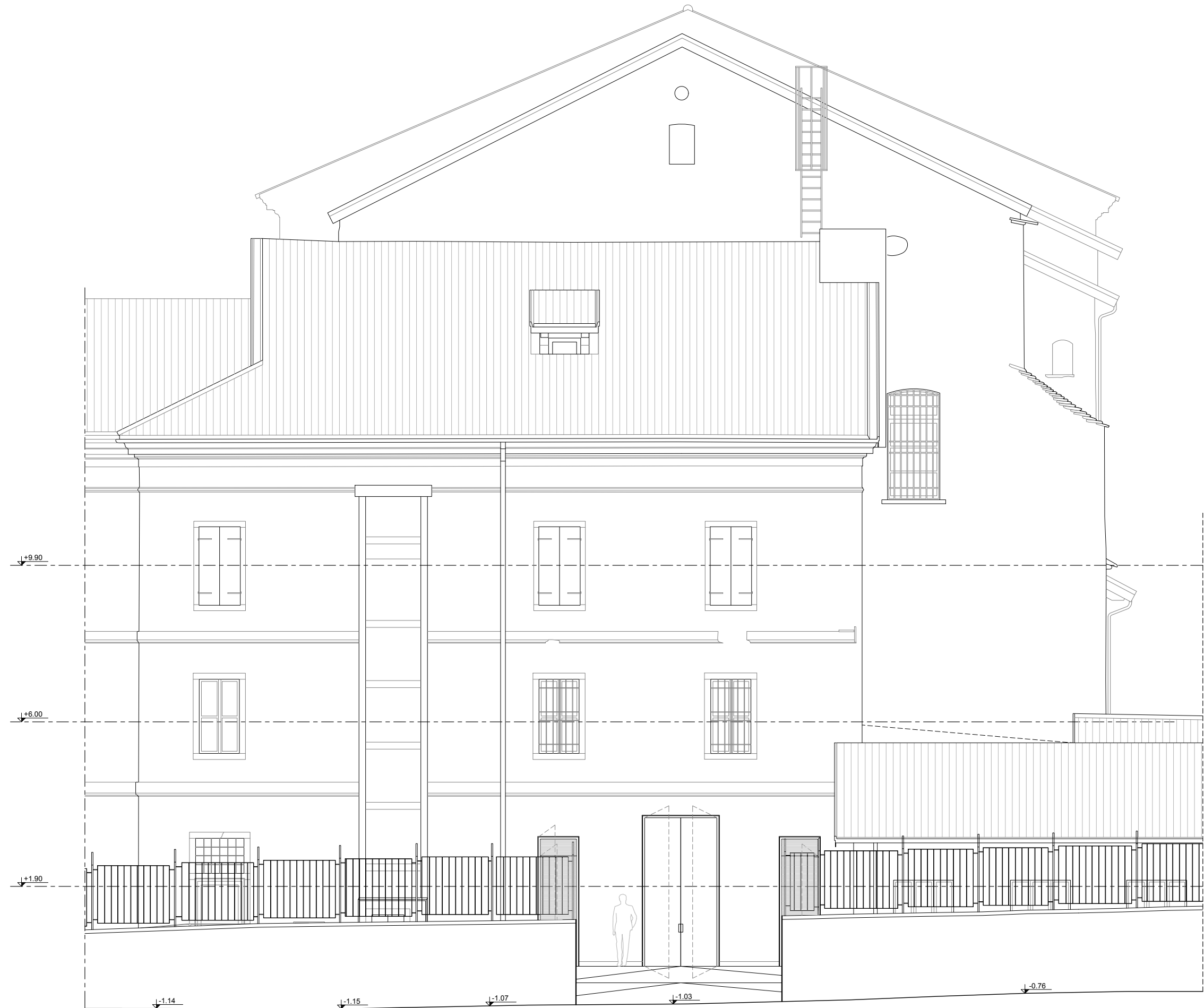
PROSPETTO NORD-EST (dal parco)