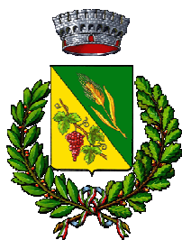
Comune di Sandrigo