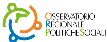
Osservatorio Regionale Politiche Sociali del Veneto