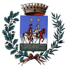
Comune di Dueville