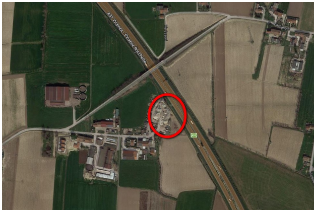
Ortofoto del sito

Nell'area facente parte del territorio del comune di Monticello Conte Otto è da anni ubicata la sede della ditta e vi sono un capannone uso ricovero mezzi e materiali, il diesel tank per il rifornimento dei mezzi e gli uffici.