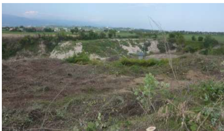
Foto discarica attuale

Sulla base dei conferimenti medi degli ultimi anni (pari a circa 4.000 mc), escluso l'evento di conferimento di rifiuto da Pedemontana, la chiusura della discarica richiederebbe circa 50 anni.