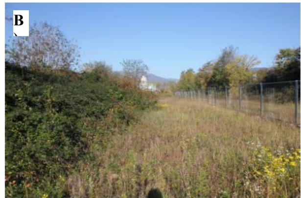
Vista nord-ovest (A) e vista nord (B)

L'area non è vincolata ai sensi della parte III del Codice dei beni culturali e del paesaggio, D.lgs. 22 gennaio 2004, n. 42. Inoltre nelle immediate vicinanze non si rileva la presenza di manufatti di carattere storico o monumentale e l'area non risulta di potenziale interesse archeologico: di conseguenza è altamente