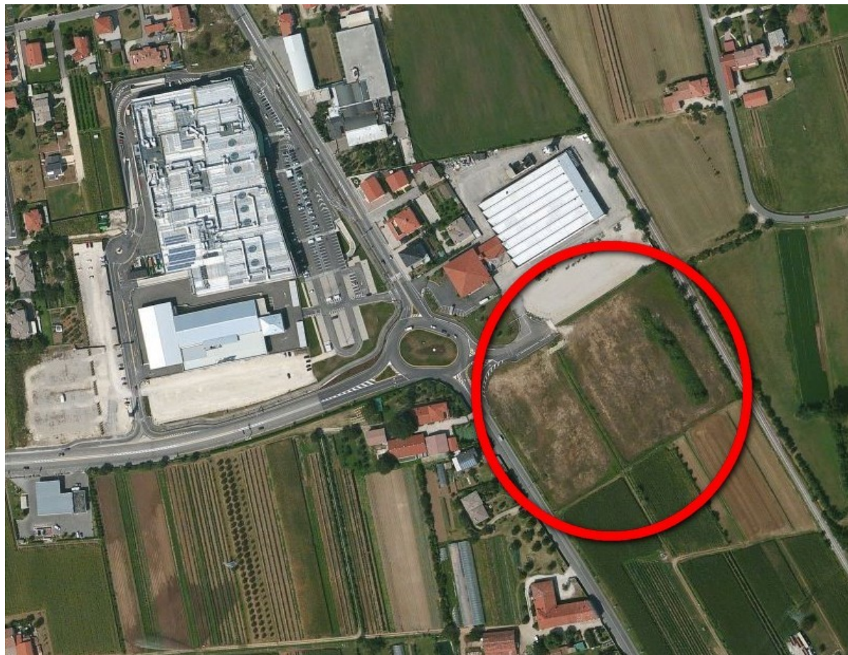
Ortofoto del sito

Domicilio fiscale e Uffici: Palazzo Godi - Nieve, Contra' Gazzolle 1 – 36100 VICENZA