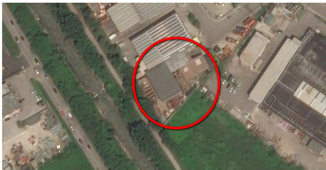
Ortofoto del sito