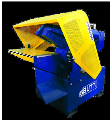
Nuova cesoia mobile

Nel sopralluogo è stato verificato che la pavimentazione nella quale avvengono le operazioni di carico, scarico e selezione, è in cls in parte ricoperta da lastre in acciaio saldate. La porzione in cls (circa 50 %) manifesta giunti di dilatazione deteriorati e smussati, crepe ed assorbimento di idrocarburi. La pavimentazione in acciaio, sovrapposta al calcestruzzo, è stata posta in opera presumibilmente per evitare, o porre rimedio ai deterioramenti derivanti da concentrazioni di carichi pesanti e dall'usura del tempo.